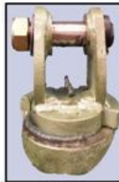
GIRO MECÁNICO DE TOPE