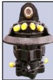
ROTATOR GIRO CONTINUADO