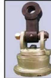
GIRO MECÁNICO DE TOPE (CON ACOPLE)